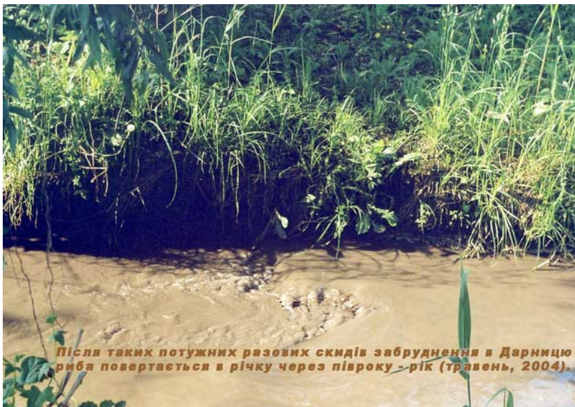
Фото 8. Диспергированные вещества в воде р. Дарницы (Киев, 2004).

А какой цвет приобретает эта вода во время разовых сбросов – видно на фото 8.