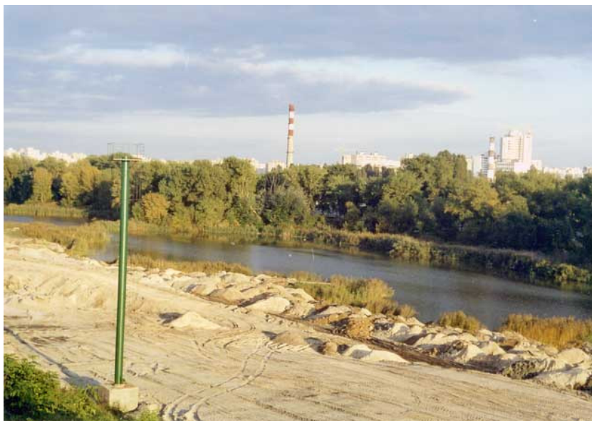
Фото 5. Прокладка автотрассы между железнодорожным полотном и озером Нижний Тельбин: этот, северный, берег озера как природный объект уже практически уничтожен (Киев, 2005)