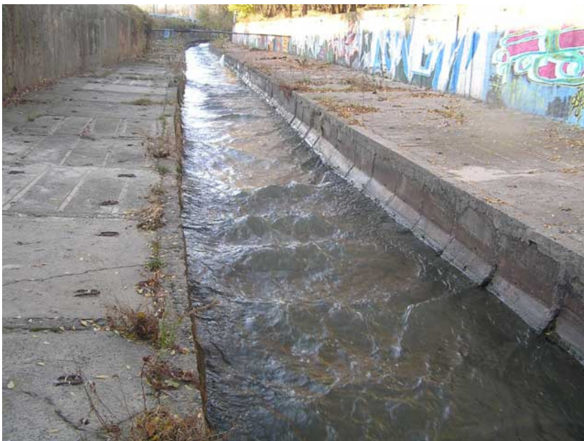
Фото 10. Русло знаменитой реки Лыбиди уже давно канализировано и безжизненно (Киев, 2005).

Кое-кто считает, что это экономия. Но на чем экономим? Достаточно лишь назвать реку – каналом и, вместо положенных в соответствии с Земельным Кодексом минимум двадцати пяти метров в обе стороны, ей выделяется лишь по пять. И о природе можно уже не беспокоиться. Почти автоматически все превращается в бетон.