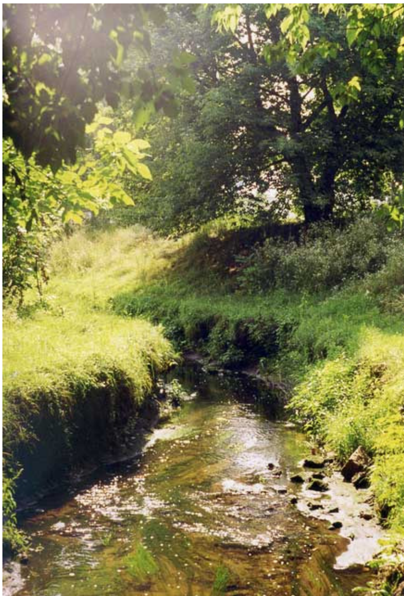
Фото 11. Река Дарница на участке «Скифская степь» - живая (Киев, 2002).