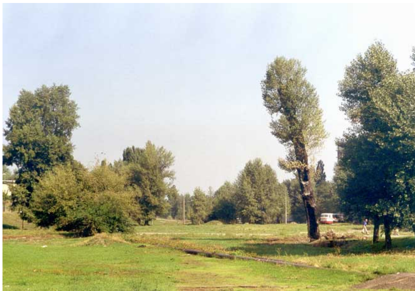
Фото 13. Река Дарница под землей у Харьковского шоссе (Киев, 2003).

Теперь, о восстановлении реки. На участке от Харьковского шоссе до улицы Пражской река Дарница на протяжении 1500 метров течет под землей в коробчатом бетонном коллекторе (фото 13, фото 14). Речная долина до сих пор была не застроена и сохранилась в состоянии, приближенном к естественному.