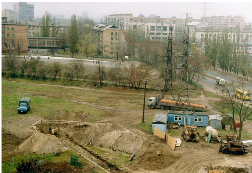
Фото 15. Земляные работы над поверхностью реки Дарница на участке по ул. Пражской, 18-в (Киев, 2004).

Ведь не могут же власти оставить эту отраву в жилом массиве навсегда? – наивно считали киевляне.