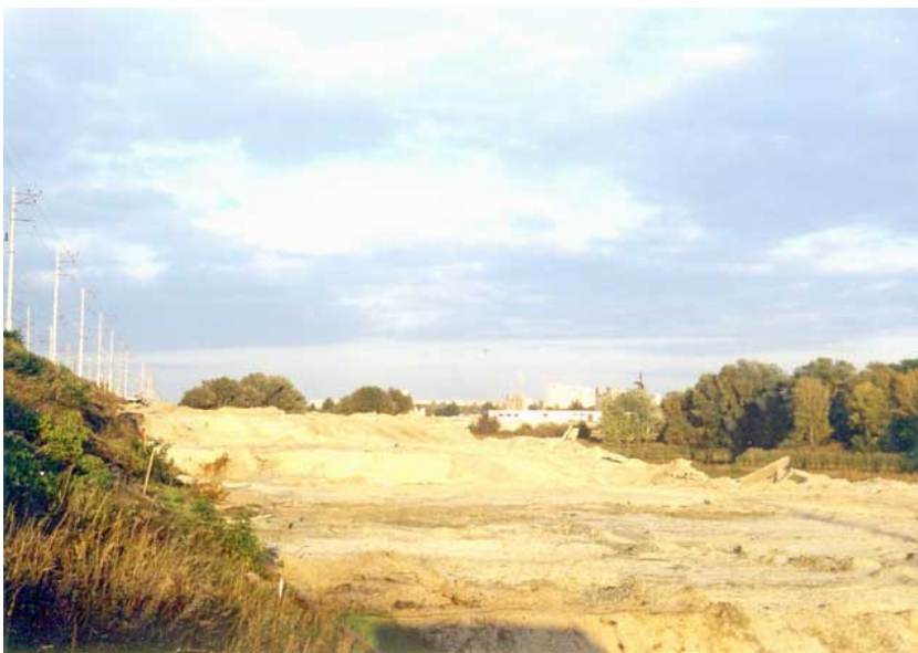
Фото 4. Прокладка автотрассы между железнодорожным полотном и озером Нижний Тельбин: впереди виднеется Колдовской Лес (Киев, 2005).

На фотографиях 4 и 5 (на следующей странице), которые сделаны летом 2005 года, вы можете увидеть, как по этим прекрасным местам в направлении «Колдовского Леса» прокладывают автомагистраль. Деревья сплошную вырублены, берег разорен, все покрыто слоем песка в 10-15 метров высотой. Природой тут уже и не пахнет. А скоро будет пахнуть выхлопными газами.