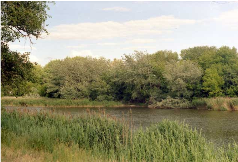
Фото 3. Другой пейзаж озера Нижний Тельбин (Киев, 2003).

Показанные на фото 2 и фото 3 пейзажи озера Нижний Тельбин – не только ласкают взор: заросли очерета создают природный фильтр-отстойник вод реки Дарницы и задерживают значительную часть отходов от попадания в Днепр. Они также являются одним из последних мест гнездования большого количества водных и прибрежных птиц (утки, погоныши, камышевки и другие....). Не так давно тут жили и серые цапли, попадался и болотный лунь, совы. В последние три года видовое многообразие птиц резко сокращается. В связи со строительными работами на берегах реки и прилегающих к ней водоемов.