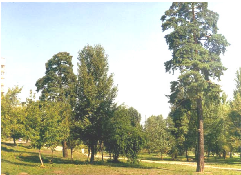
Фото 14. Долина р. Дарницы возле ул. Лохвицкой (Киев, 2003)

Главной достопримечательностью парка должно было стать русло возрожденной реки в богатом природном окружении.