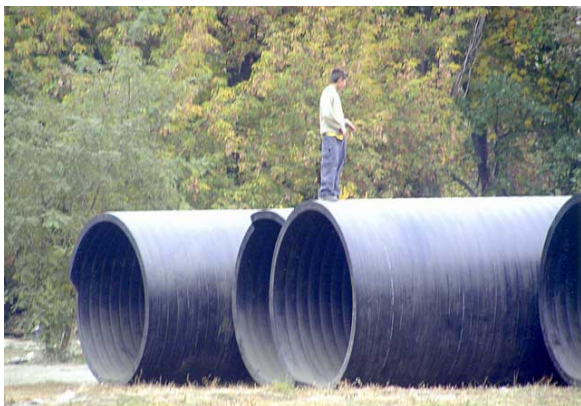
Фото 19. Прокладка канализационного коллектора по руслу р. Дарницы (Киев, 2005)

Посмотрим на фото 19. Вот такие пластиковые трубы двух-метрового диаметра в октябре 2005 завезены и складировались на территории гипотетического парка «Зеленая Тишина».