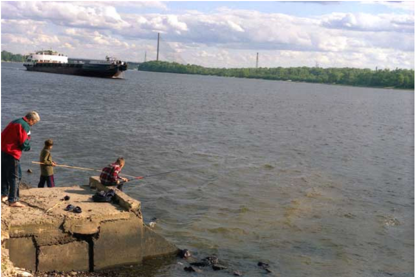
Фото 6. Рыбная ловля в Днепре на устье реки Дарницы (Киев, 2004)

замаскировано под хорошо оформленную бетонную набережную.