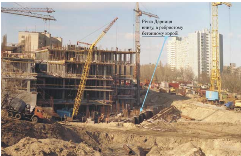
Фото 16. Земляные работы и обнажение бетонного короба, по которому пропущена река Дарница на участке по ул. Харьковское шоссе, 19 (Киев, 2005).

На фото 16. вы видите строительную площадку на Харьковском шоссе, 19. Исполняющий обязанности начальника Государственного управления экологии и природных ресурсов в г. Киеве В.Ольшевский так определил статус данного строительства: