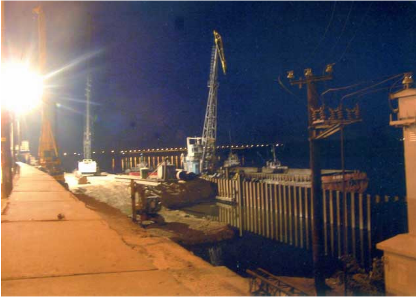
Фото 7. Строительные работы на устье реки Дарницы (Киев, 2005).

Посмотрим на фото 7. На нем сфотографировано то же самое устье реки Дарницы, что и на фото 6., но фотография сделана год спустя, в 2005 году, когда тут полным ходом развернулось строительство нового железнодорожно-автомобильного моста. Набережную в связи с этим тоже перестраивают. Вон там, где стоит кран, воды Дарницы вливаются в Днепр.