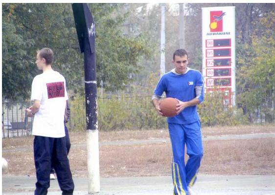
Фото 18. Школьный стадион киевской общеобразовательной школы № 126 «обогатился» автозаправочным комплексом. «Вытеснение» детей началось. (Киев, 2005).