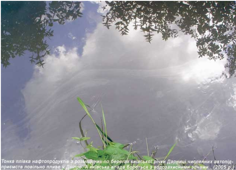
Фото 9. Нефтепродукты в р. Дарнице (Киев, 2005).

Масляные пятна горюче-смазочных материалов, которые видны на фото 9 – на ее поверхности появляются постоянно.