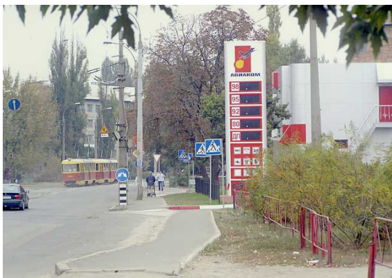
Фото 17. Автозаправочный комплекс на р. Дарнице (Киев, 2005).

На другом конце парка «Зеленая Тишина», на улице Пражской, строительство уже завершено: