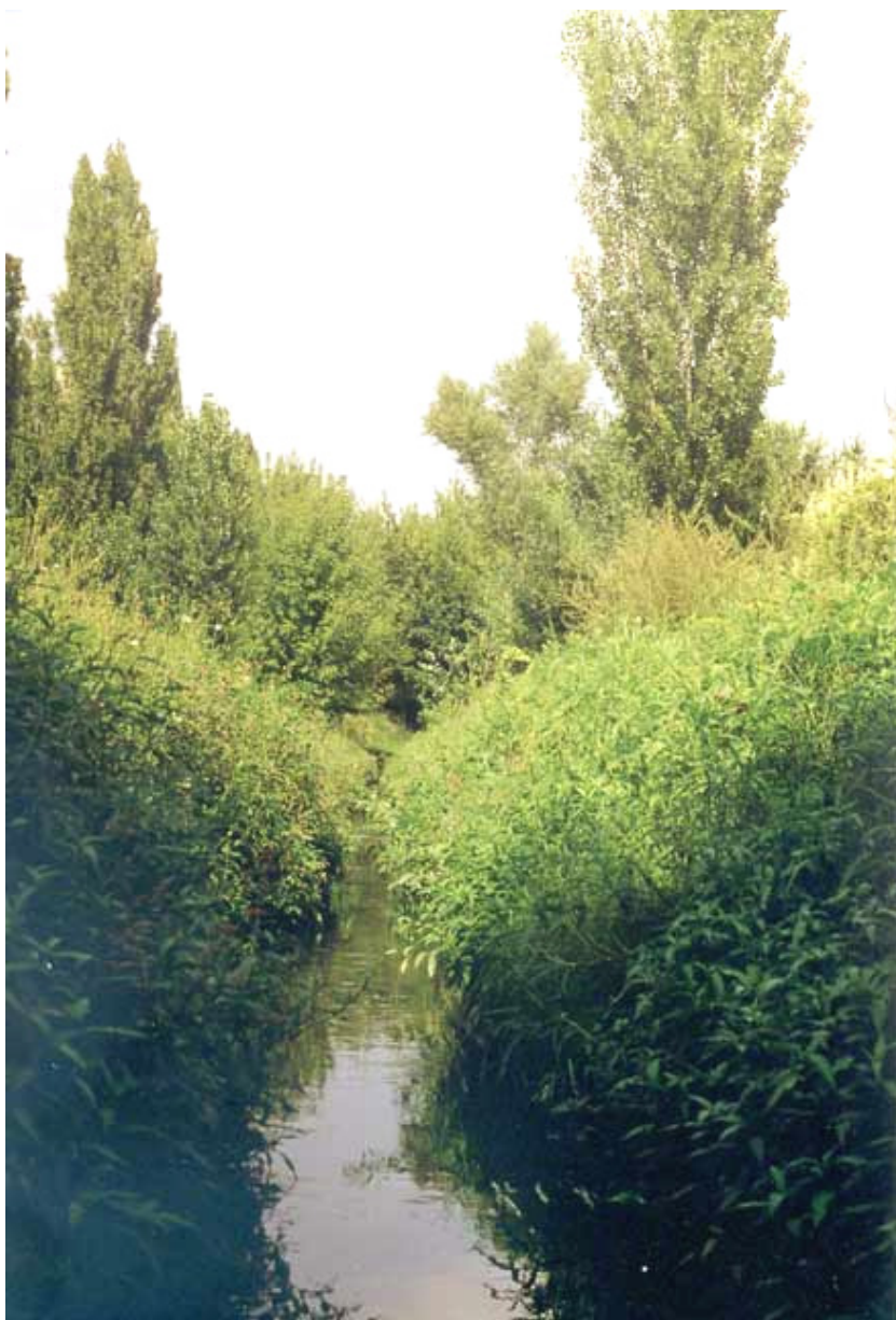
Фото 12. Там же, «Скифская степь». Русло хоть и выпрямлено, но живет (Киев, 2002).