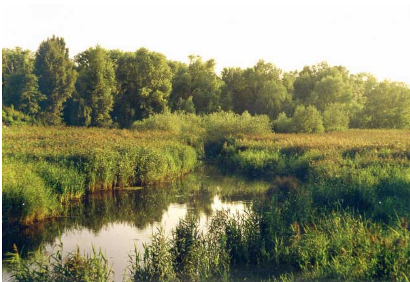
Фото 2. Один из пейзажей озера Нижний Тельбин (Киев, 2001).

Строительство автострады было начато в 2004 году. Но тогда началась кутерьма с выборами, у строителей, к счастью, не хватило денег на строительство, и мощная техника была остановлена за несколько сот метров от урочища. Вот так, благодаря президентским выборам 2004 года, «Колдовской Лес» и дожил до 2005 года.