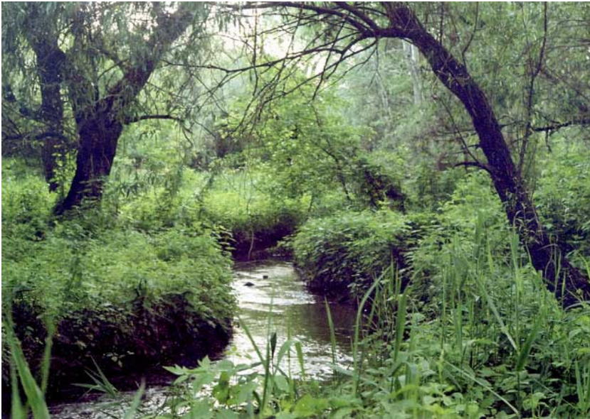
Фото 1. Урочище «Колдовской Лес» (Киев, 2003)

Будет ли способствовать эта магистраль решению транспортных проблем – отдельный вопрос, но экологические проблемы она ставит серьезные.